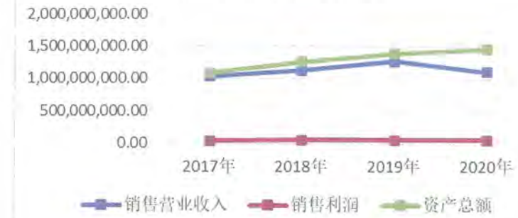
成长能力指标（单位：元）

近三年，如上图，销售营业收入整体呈小幅上升趋势，三年销售营业收入平均增长率为2.05%，持续扩张势头尚可。2020年，销售（营业）收入增幅较上年下降13.16%，远低于行业平均水平，近期扩张势头有所放缓。近三年，销售利润波动幅度较大，三年销售（营业）利润平均增长率为-14.17%，公司持续获利能力一般。2020年，毛利率由13.85%上升到16.24%，销售利润增长率较上年大幅上升且略高于行业平均水平，近期市场效益性较强。近三年，三年总资产平均增长率为10.40%，高于三年销售营业收入平均增长速度，销售收入增长的效益性一般。2020年，总资产增长率低于行业平均水平，整体规模偏高。